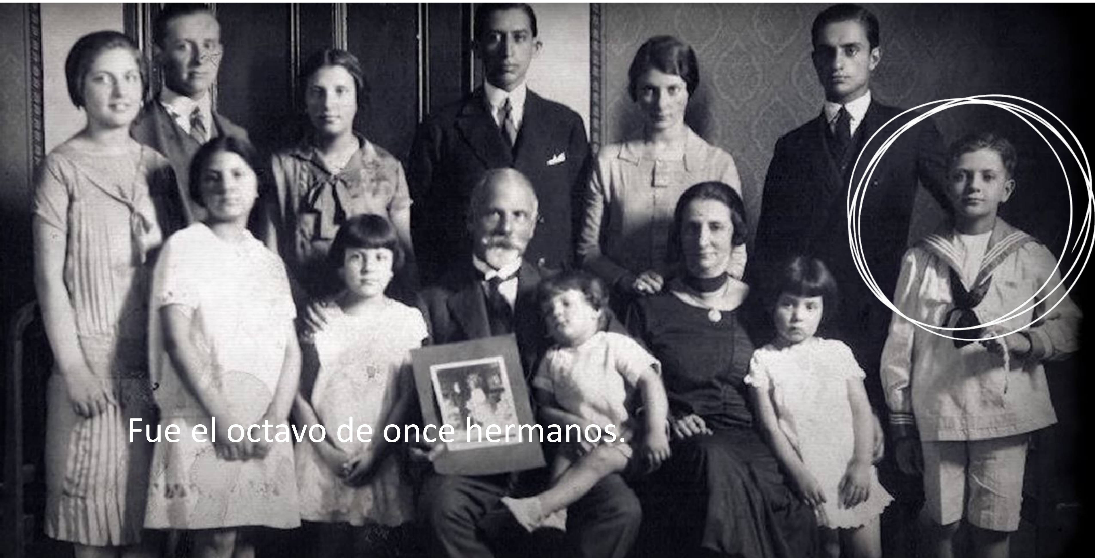
Fue el octavo de once hermanos.