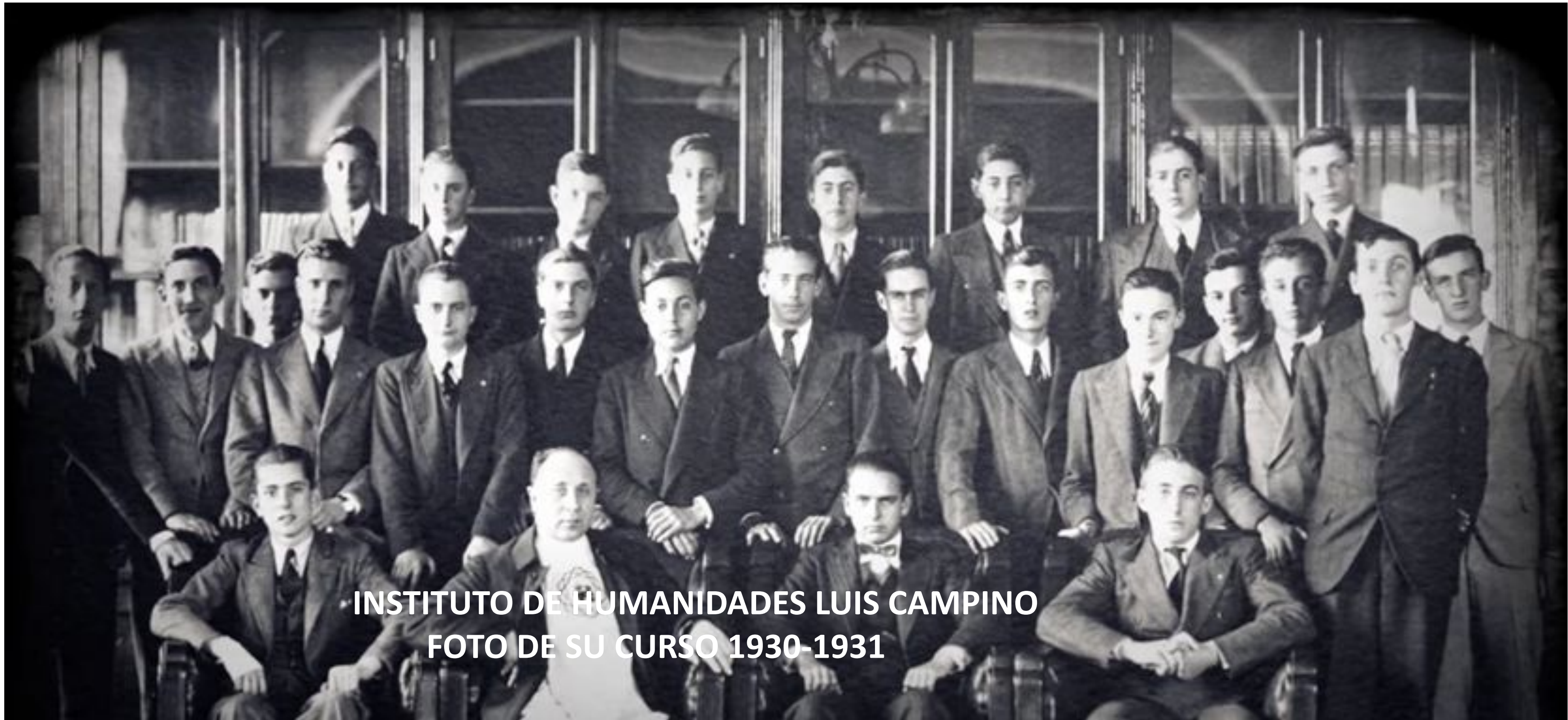
INSTITUTO DE HUMANIDADES LUIS CAMPINO FOTO DE SU CURSO 1930-1931